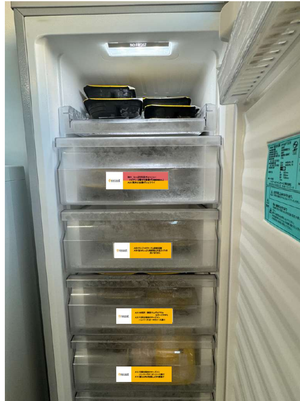
引き出しごとに商品を入れて整理します。 ラベルをつけて商品も分かりやすく表示可能です。